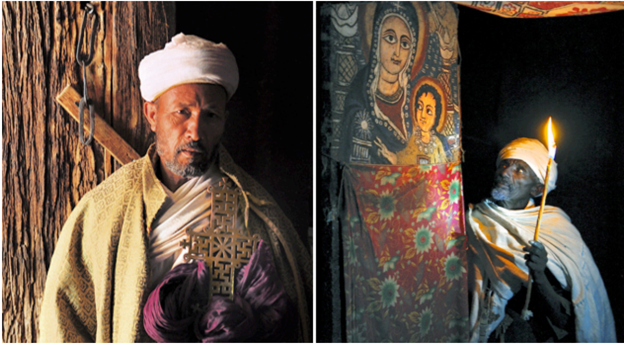
Prêtres à Lalibela

L’Ethiopie tient une place particulière en Afrique. Jamais colonisée, elle développa une culture spécifique et originale issue de ses racines chrétiennes qui ont fait d’elle le deuxième royaume au monde, après l’Arménie, à adopter cette religion.