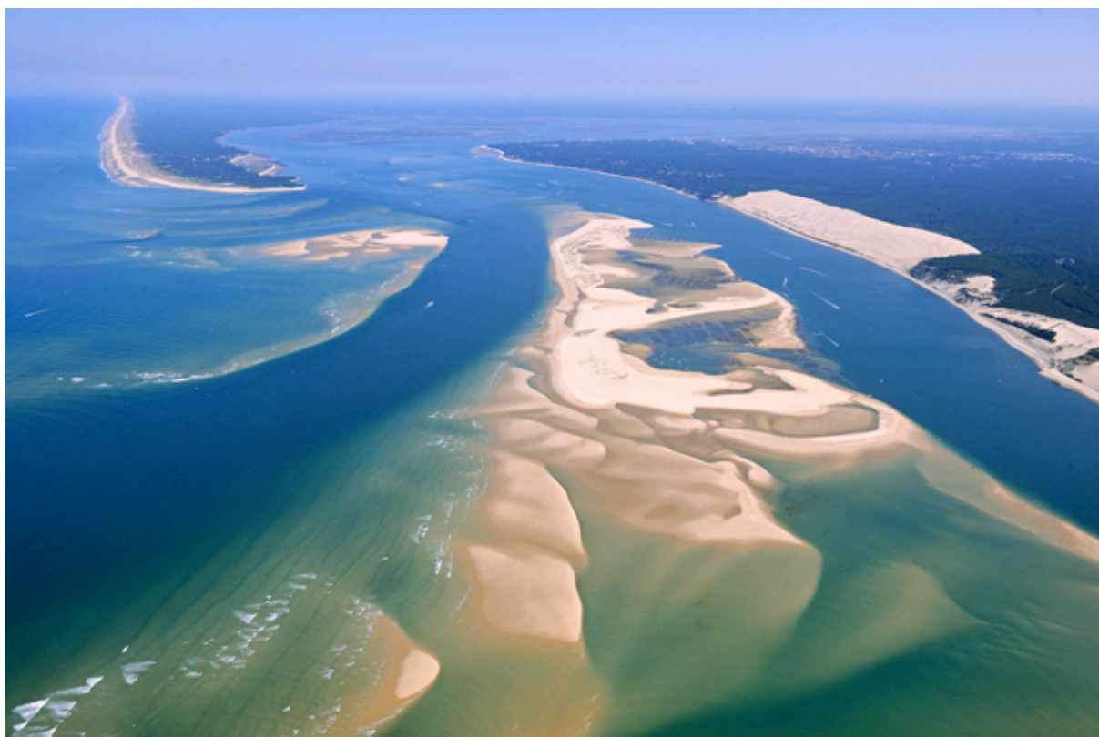
Le Banc d'Arguin, la dune du Pilat et le Cap Ferret.